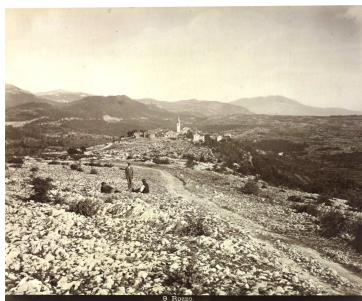
Roč / Rozzo