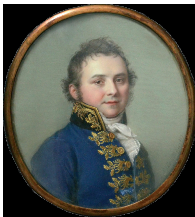
Pietro Nobile (1776-1854)