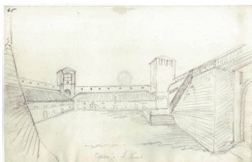
Savičenta / Sanvincenti