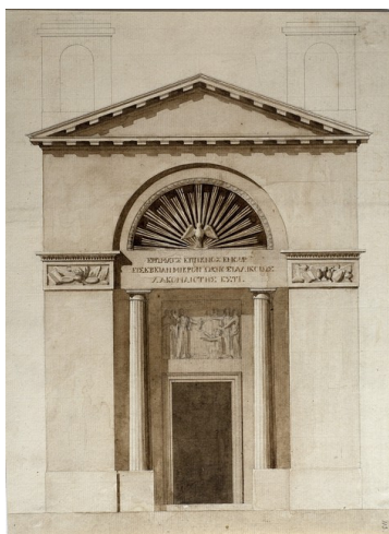
Piran, sv. Peter / Pirano, S. Pietro