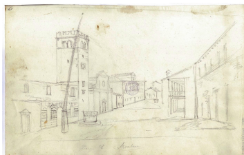
Motovun / Montona