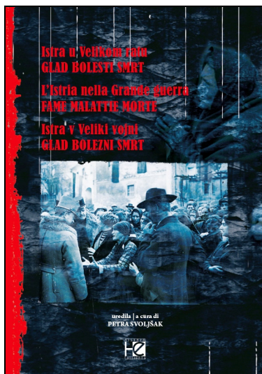
Naslovnica / Copertina