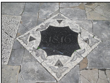
Koper, osrednji trg Capodistria, piazza centrale (detajl / dettaglio)