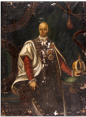
Franz Joseph Karl von Habsburg-Lothringen (Firenze, 1768 - Wien, 1835) PMK, 3090

Franco I. je močno zaznamoval tisto prelomno zgodovinsko obdobje tudi kot gostitelj Dunajskega kongresa (1814-1815), ko je Istra dokončno prišla pod habsburško oblast. Pod njegovo vladavino se je Istra začela povezovati v trdno in enotno upravno-teritorialno celoto.